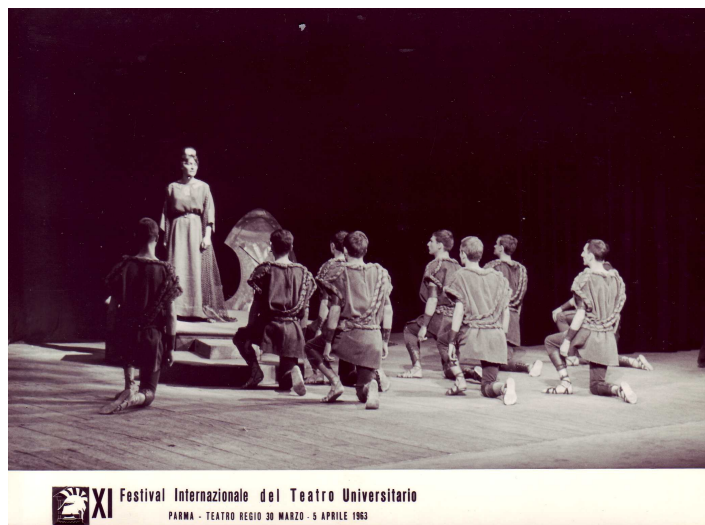
Représentation d'Ajax dans la mise en scène de Jacques Lacarrière en 1963

Toute son œuvre est comme un chant des insoumis, une fresque où se côtoient maudits, pestiférés, vaincus, humiliés, cadavres pourrissant hors des murs, exilés, mendiants, dépossédés ! J.L.